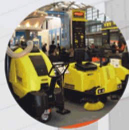
机器设备 Machinery and equipment