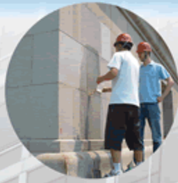
技术研发 Technology development