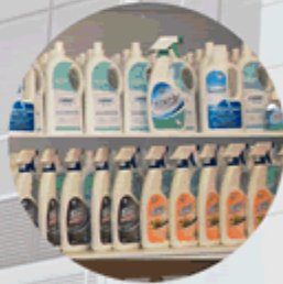
产品配送 Products distribution