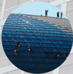
工程实例 Building construction