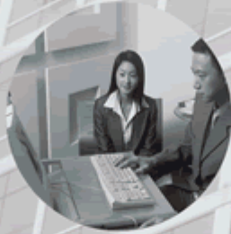
售后服务 After-sale services